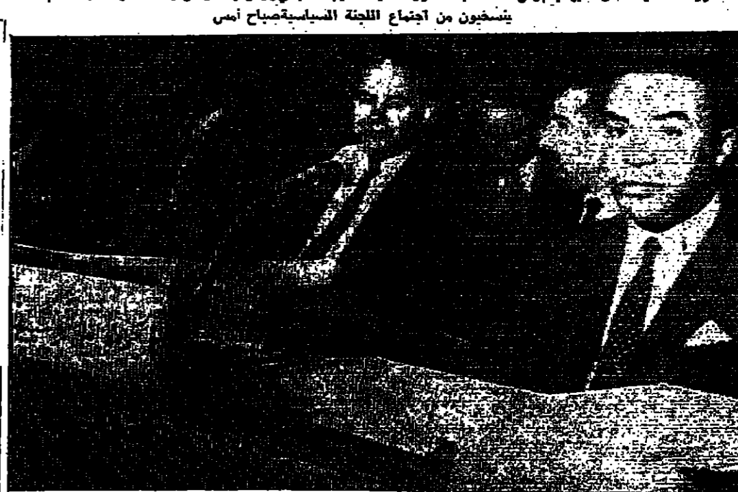
السفير السجاني في مقدمه خلال اجتماع اللجنة السياسية قبل ارتشبحين الاجتماع

٣ ضباط كبار لا ٣ جنود يسود الاعتقاد في الضفة الغربية ان اسرائيل قد قتلت ثلاثة ضباط كبار في الكمين الذي نصبه القذافيون على الضفة الشرقية لقناة السويس وليس ثلاثة جنود كما تقول اسرائيل . وذهب بعض الجاهل الى القول بان قائد البحرية الاسرائيلي الذي أعلن عن خلف له قبل يومين هو «الجندي» القتود في الكمين .